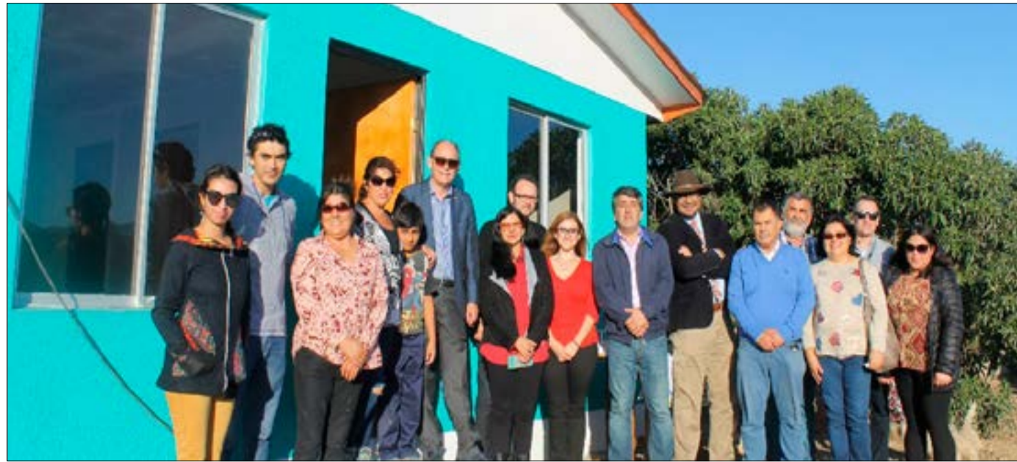
Las familias estuvieron felices en la entrega de sus viviendas

Cabe destacar que el proyecto reúne los conocimientos en astrofísica y astronomía del director, para aportar en la problemática hídrica de Atacama, a través del diseño de un sistema que aproveche el agua niebla disponible y las energías renovables a partir del viento y del sol.