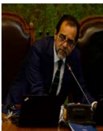
EL NOTICIERO DEL HUASCO

El miembro de la comisión de Transportes de la Cámara, Jaime Mulet, lamentó el episodio en donde un conductor de Uber resultó baleado por un carabiniero, tras oponerse a ser fiscalizado por el funcionario, y solicitó que el Ejecutivo pueda acelerar el ingreso de las modificaciones al proyecto que regula este tipo de plataformas tecnológicas.