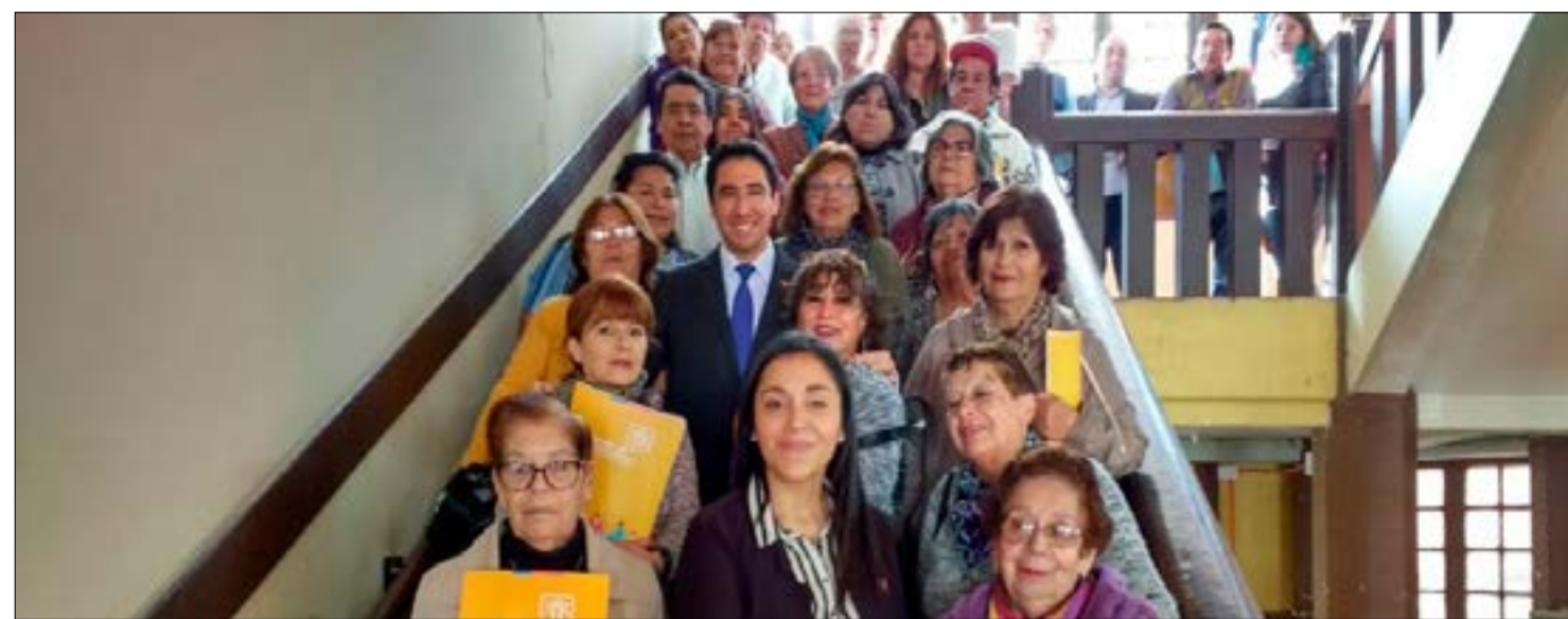
En la gobernación provincial del Huasco se realizó lanzamiento de fondo social

Para la región de Atacama se esperan posibles lluvias durante este domingo 10, hasta el lunes 11 al mediodía, precipitaciones de 5 hasta 15 milímetros, según lo indicado por el director regional de la Oficina Nacional de Emergencias –Onemi-, Javier Sáez Vásquez. Por este motivo el Comité de Emergencias municipal estará operativo mañana con sus vehículos municipales, los cuales se harán presente en los diferentes sectores poblacionales de la comuna de Vallenar. Para cualquier tipo de información o solicitud, puede hacerlo a través de Whatsapp en los siguientes números: +569 98992995 - +569 98992408, o al teléfono fijo 512 672390.