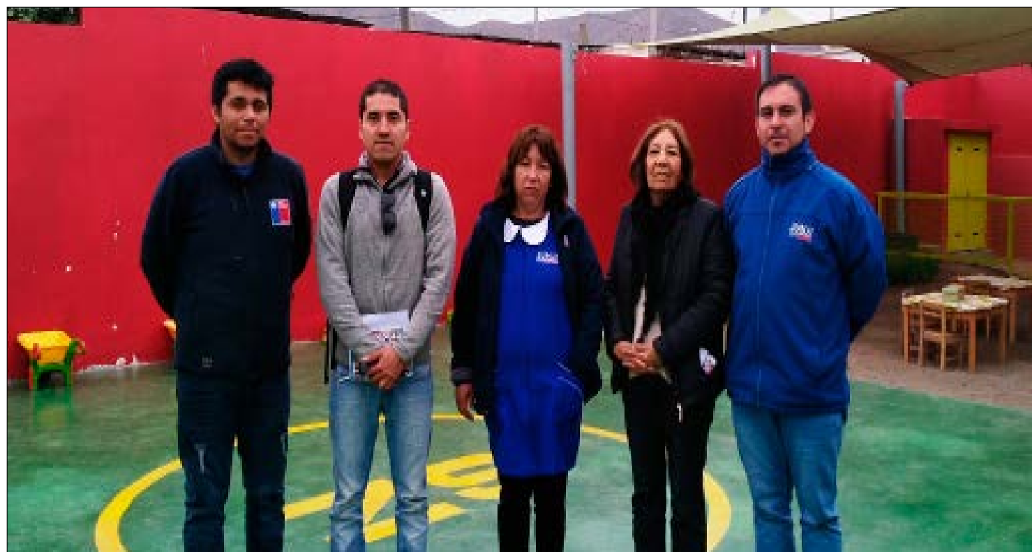
Desde la Junji llegaron hasta localidades alejadas de la provincia del Huasco

Para conocer más detalles sobre el proceso, la medida a consultar y los requisitos para participar se habilitó el sitio consultaindigena.mineduc.cl