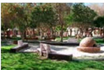
EL NOTICIERO DEL HUASCO

El Ministerio de Educación invita a participar de la consulta indígena sobre la propuesta de Bases Curriculares para la asignatura de Lengua y Cultura de Pueblos Originarios de 1º a 6º básico, que se realizará en la región en dos encuentros. El primer, programado para este martes 10 de julio, se realizará desde las 10:30 horas, en el Liceo de Alto del Carmen y el segundo, el jueves 12, en las oficinas de la Secretaría Regional de Educación ubicada en Chañarillo N° 550, Copiapó.