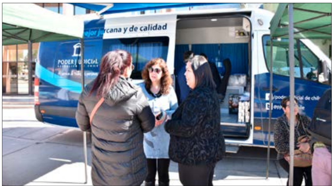
Durante la jornada de ayer estuvo en la comuna de Huasco

En todos los casos, funcionarios judiciales expertos en las distintas materias atenderán público entre las 9:30 y 14:00 horas