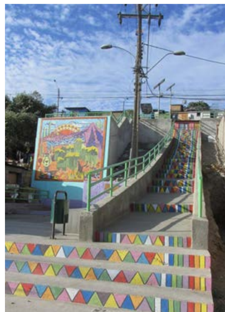
En la población Hermanos Carrera de Vallenar, están estas escalinatas que dan vida al sector. No es la única, pues se han recuperado la mayor parte de ellas., que se ubican en la misma población.