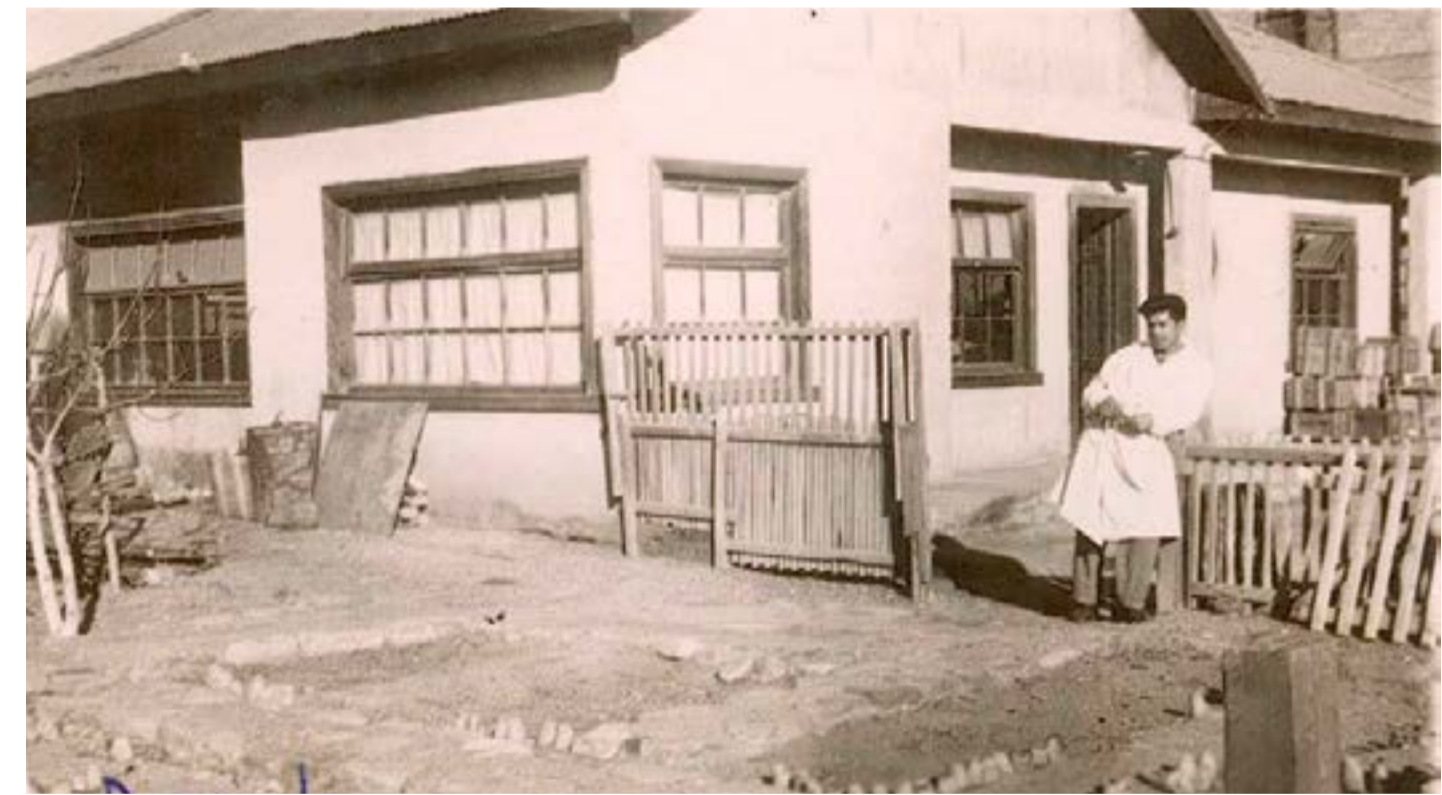
Vecino de Domeyko, 1950

El Noticiero del HUASCO .cl Papel digital