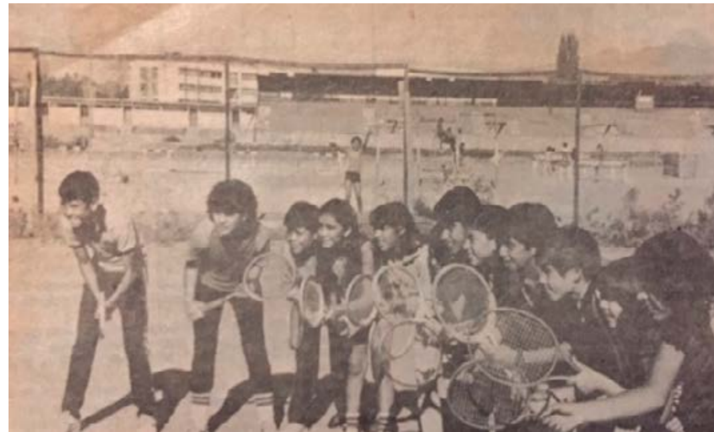
En la fotografía, un grupo de niños de la ex escuela de tenis de Vallenar posa para el lente de un diario regional. Detrás, un grupo de niños realiza otras disciplinas deportivas en el estadio municipal.