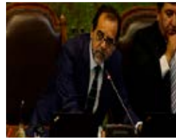
EL NOTICIERO DEL HUASCO

El diputado de la Federación Regionalista Verde Social, Jaime Mulet, presentó este jueves un proyecto de ley, que modifica el Código del Trabajo, para ampliar el derecho a permiso pagado a trabajadores para realizarse cualquier tipo de exámenes médicos. Al respecto, el primer vicepresidente de la Cámara de Diputados, explicó que “hemos visto en terreno que hay innumerables consultas médicas de especialistas que se pierden porque no llegan las personas a las consultas médicas, tanto en el sistema público como privado. Muchas de esas consultas se pierden porque los trabajadores o trabajadoras no pueden asistir al médico o los médicos dependiendo el caso. De manera que lo que buscamos con este proyecto de ley es que los trabajadores y trabajadoras puedan tener cada año al menos medio día para poder concurrir a una consulta médica, debidamente acreditada por cierto, ya sea en el sistema público si es Fonasa, o en el sistema privado si el trabajador tiene isapre”.