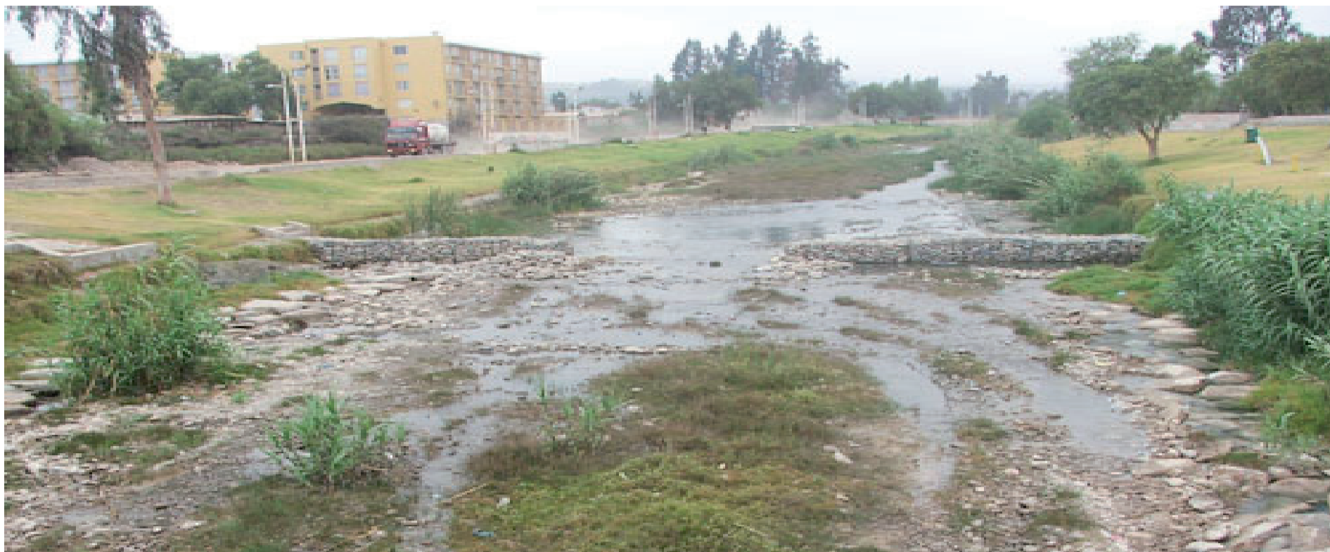
Una imagen del río Huasco hace algunos años atrás. Parlamentarios esperan que no se repita