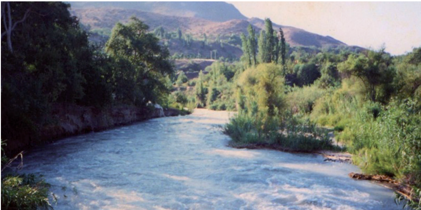
FOTOGRAFÍA DE PÁGINA HISTORIA DEL VALLE DEL HUASCO