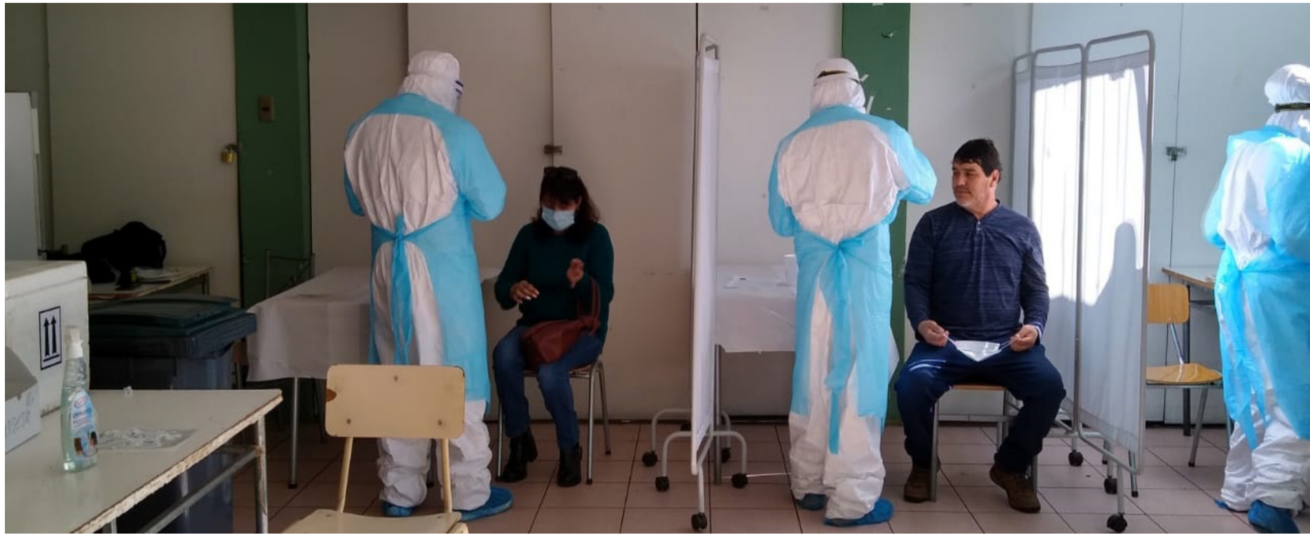
En diferentes puntos de la comuna se están realizando los testeos masivos