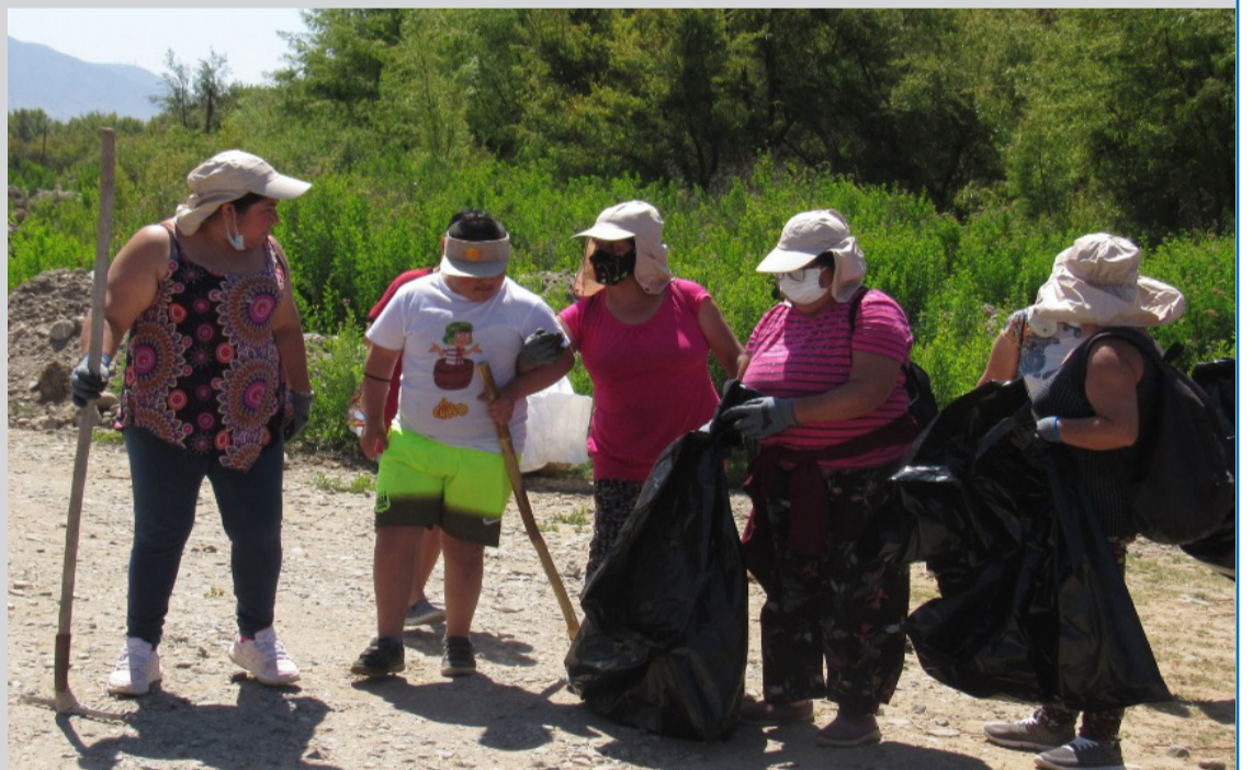
Los vecinos fueron con todos sus implementos hasta el río Huasco.