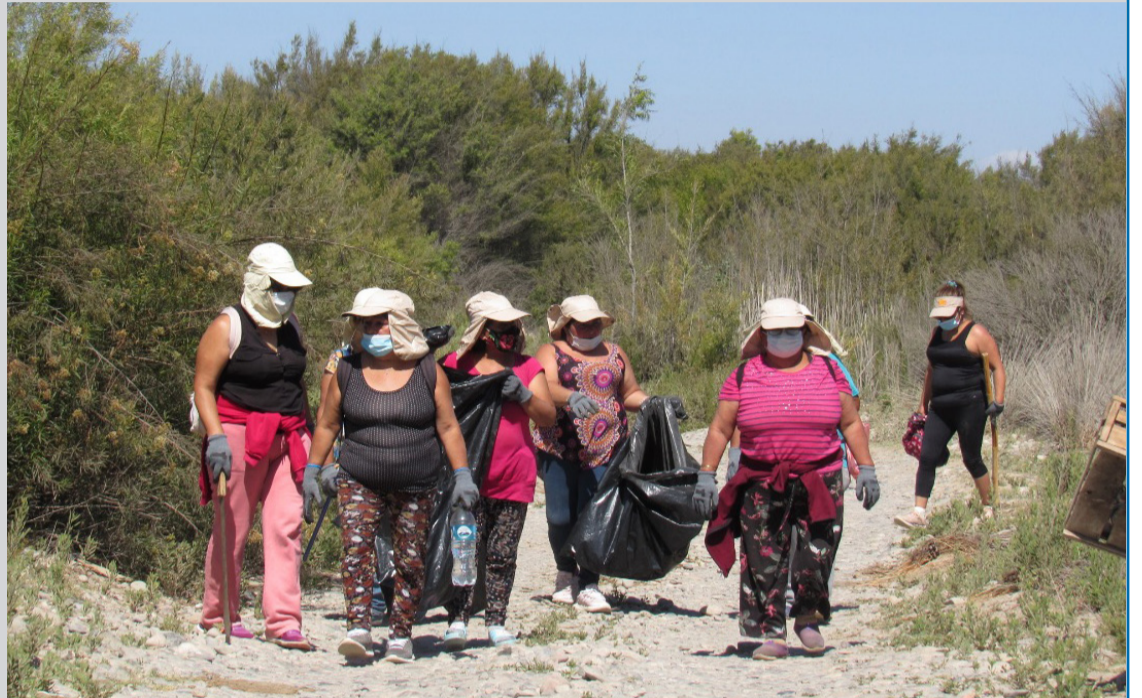
Esta es la primera jornada de siete, que organizó el municipio de Freirina

Finalmente desde la oficina del Medio ambiente solicitaron la colaboración de los vecinos al momento de cargar el camión con los residuos, ya que “si bien contamos con tres cargadores, de igual forma le pedimos a los vecinos el apoyo al momento de cargar el camión, porque la cantidad y el volumen que eliminan los vecinos es muy grande, entonces igual se solicita el apoyo y la colaboración”.