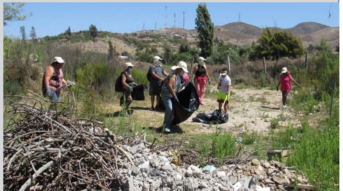
La jornada es parte del programa de Gestión Ambiental del municipio.