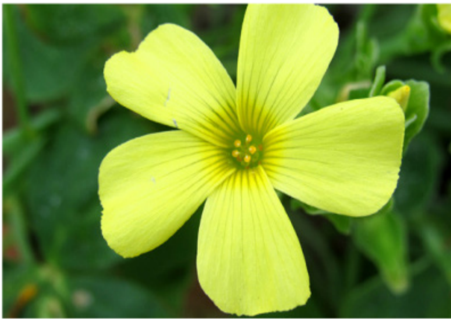
SENECIO Senecio bahioides