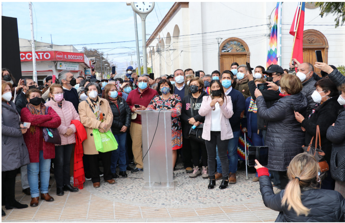
VECINOS: Partidarios, militantes y vecinos llegaron a la plaza O'Higgins para presenciar el acto