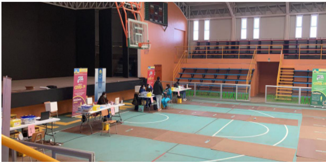
VACUNATORIO: Expedito en diversos horarios se encuentra vacunatorio municipal