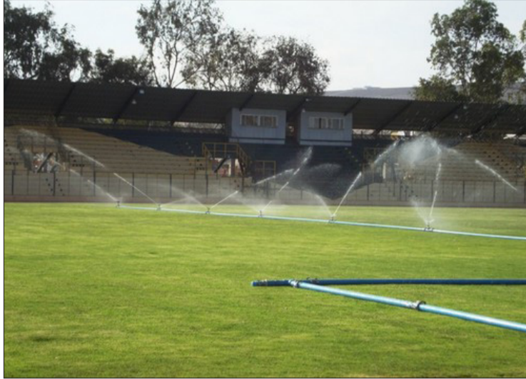
SIN LOCALÍA: Estadio debe tener autorización para que se juegue.

Las cosas no han sido fáciles para Deportes Vallenar en los últimos años. Junto con perder la categoría en el profesionalismo y tener una compleja labor administrativa y financiera, ahora el club está sin contar con estadio para disputar el torneo de Tercera A en 15 días más. Mediante una declaración pública, el club señaló que "ante el no pronunciamiento hasta ahora de la municipalidad de Vallenar a la solicitud de uso del estadio "Nelson Rojas Rojas", se han iniciado las gestiones administrativas para poder contar con un recinto deportivo dentro o fuera de la Región de Atacama en la que nuestro equipo pueda hacer su debut el próximo sábado 21 como local ante Provincial Ovalle, abriendo la primera fecha de la competencia 2021 Zona Norte de Tercera División "A". "La institución solicitó la utilización del recinto deportivo mediante oficio ingresado el pasado 19 de julio. Recién el 27 del mes pasado, se nos informó que la municipalidad está en pleno proceso de reorganización y evaluación de su situación financiera. Si bien se nos manifestó dispo-