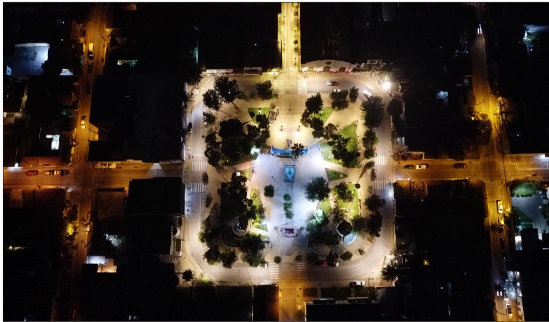
La Delegada presidencial de la Provincia destacó la necesidad de planificar estratégicamente para atraer inversiones. Alcalde también se refirió a la situación.