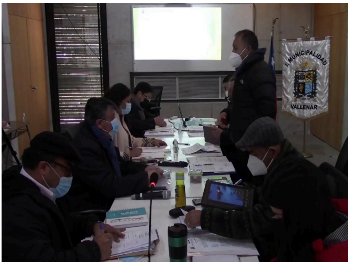
TRABAJO: Concejo municipal aprobó medidas presentadas por alcalde