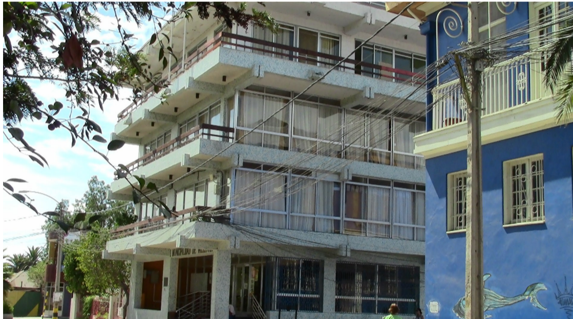
Herrera señaló que en la Ilustre Municipalidad de Vallenar “se daba y se da una situación anómala y particular, que consiste en una especie de co-gobernanza” supuestamente entre alcalde y su pareja.

“Asistía a reuniones del alcalde con el equipo de confianza..., fuera de las reuniones daba instrucciones y órdenes... y a otros funcionarios, en un comienzo