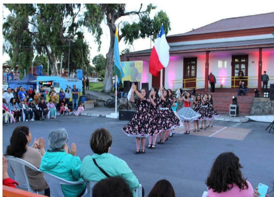
LA PRESENTACIÓN SE REALIZÓ FUERA DE LA OFICINA DE TURISMO Y BIBLIOTECA DE HUASCO