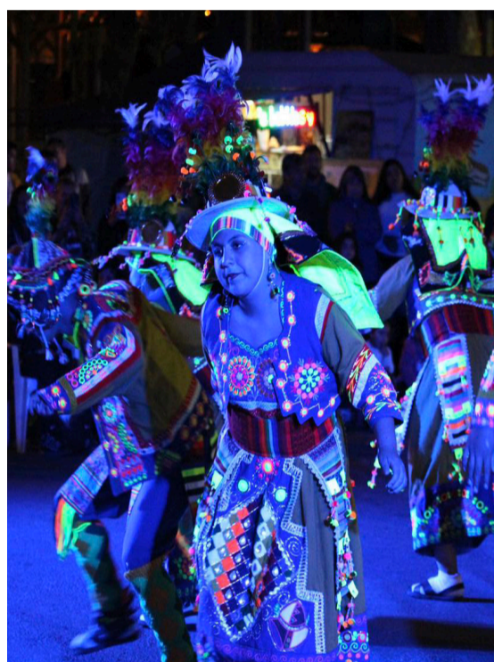
CARNAVALES, TINKUS Y SAYAS FUERON PARTE DE LA ACTIVIDAD