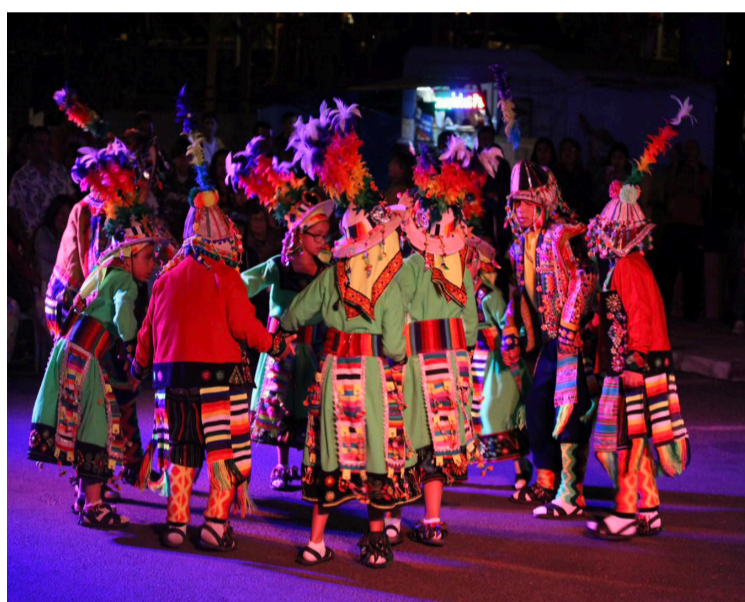
LOS TINKU FUERON PARTE DE ESTA ACTIVIDAD