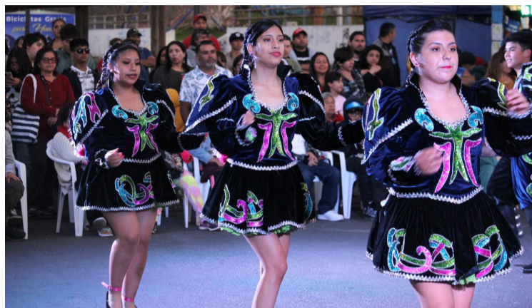
LA COMUNIDAD OBSERVÓ RESPETUOSAMENTE LA PRESENTACIÓN

La agrupación local, "Sentimiento Cuequeros" del Huasco, bailó cueca en diferentes presentaciones de nuestro baile nacional, y la agrupación vallerina, presentó samba caporal y tinkus.