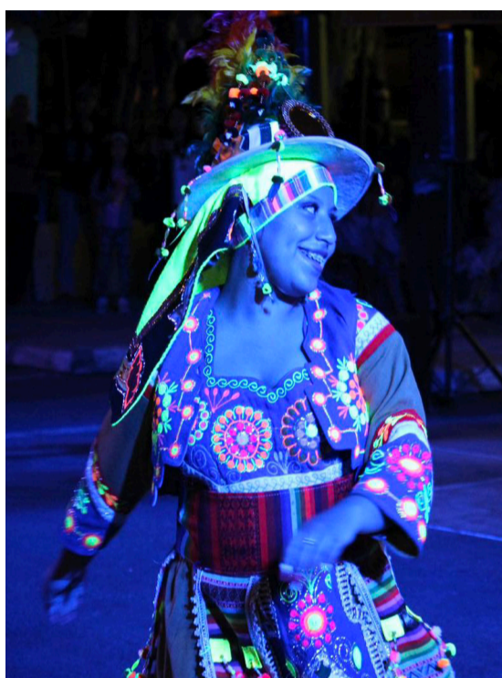
LOS BAILES SE TOMARON EL FIN DE SEMANA EN HUASCO